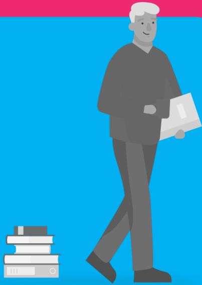
De analoge idealist (ook wel de digistarter)

Neigt naar of is negatief, wil vooral de beste zorg leveren en heeft een afkeer van alles wat met digitalisering te maken heeft.