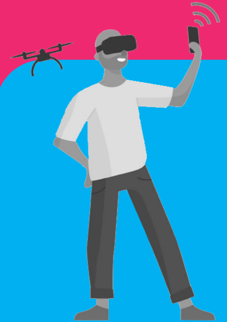
De digitale enthousiasteling

Weet zijn weg met digitale middelen prima te vinden, maar spant zich niet bovenmatig in om met de nieuwste digitale middelen te werken.