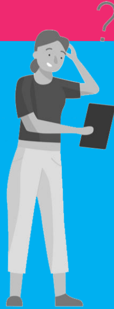
De aarzelende technologiegebruiker

Neigt naar of is negatief, wil vooral de beste zorg leveren en heeft een afkeer van alles wat met digitalisering te maken heeft.