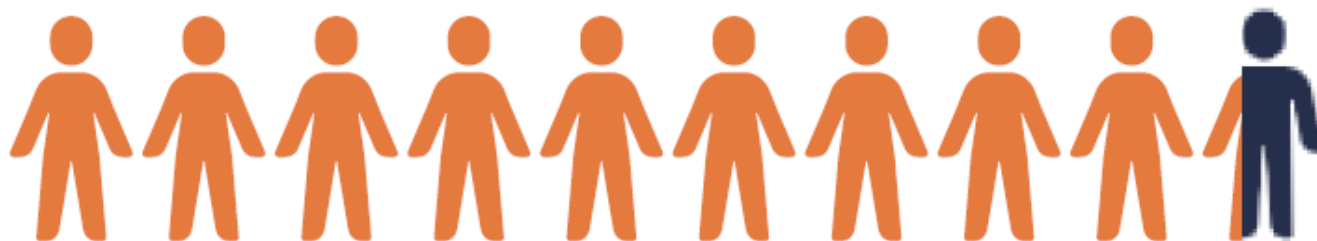
Figuur 4. Digitale ontwikkeling bij respondenten

67% van de medewerkers zou willen dat de digicoach een vaste rol in de organisatie is.