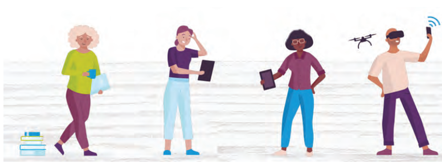
DE ANALOGIE IDEALIST (OOK WEL DE 'DIGISTARTER')